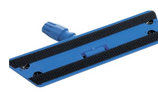
55 cm - Code 020190