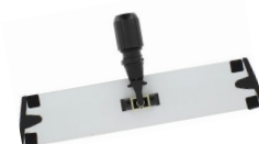
40 cm Alu - Code 210056