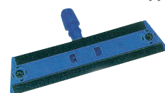
40 cm - Code 020189